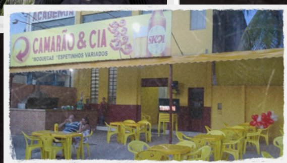
Primeira unidade 2011 (Transferida Para o Cais)