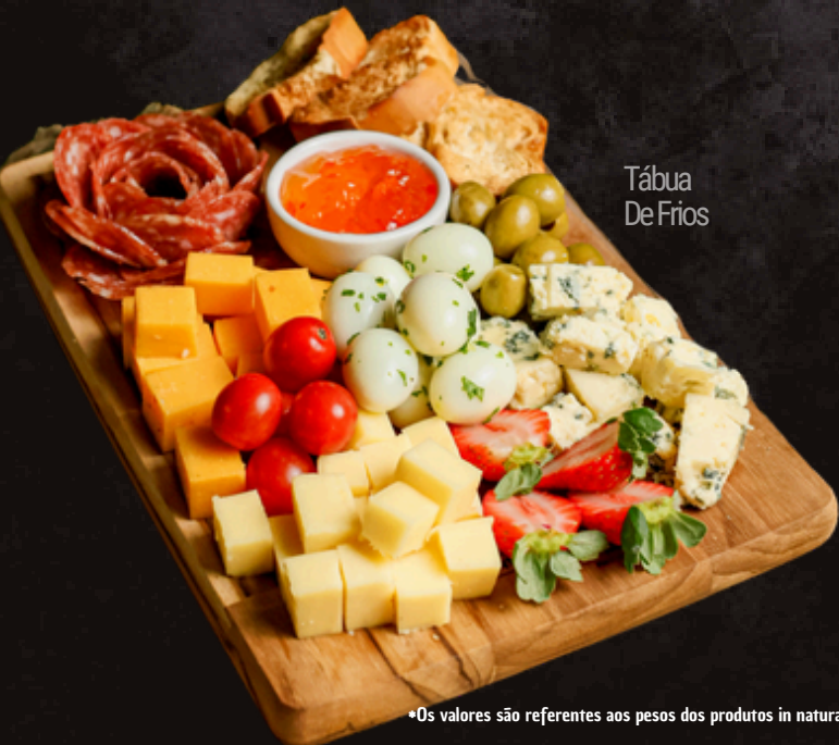
Tábua De Frios

Salame, queijos (muçarela, provolone, gorgonzola), ovo de codorna, azeitona verde, torradas e geleia de pimenta)